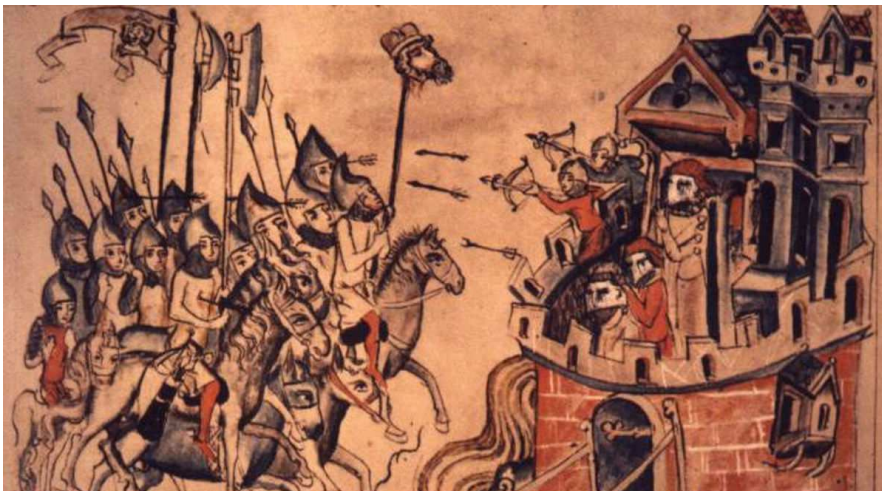
Bitwa pod Legnicą 1

W tym okresie kraj znalazł się w obliczu silnych zagrożeń zewnętrznych ze strony Niemiec, wzrosło znaczenie możnowładztwa i wyższego duchowieństwa. Książęta nie współpracowali ze sobą, co osłabiło znacząco władzę. Brandenburgia zajęła ziemię lubuską, a księstwa śląskie uzależniły się od władzy Czechów. W 1226 roku Konrad Mazowiecki sprowadza na ziemie polskie Krzyżaków, którzy staną się zagrożeniem na następne stulecia. W 1241 roku kraj przeżywa najazd Tatarów (krwawa bitwa pod Legnicą).